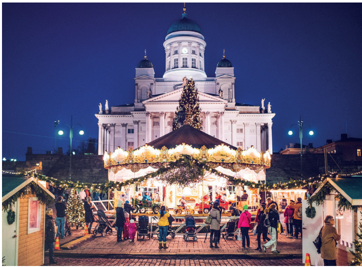
Senatstorget, Helsingfors.